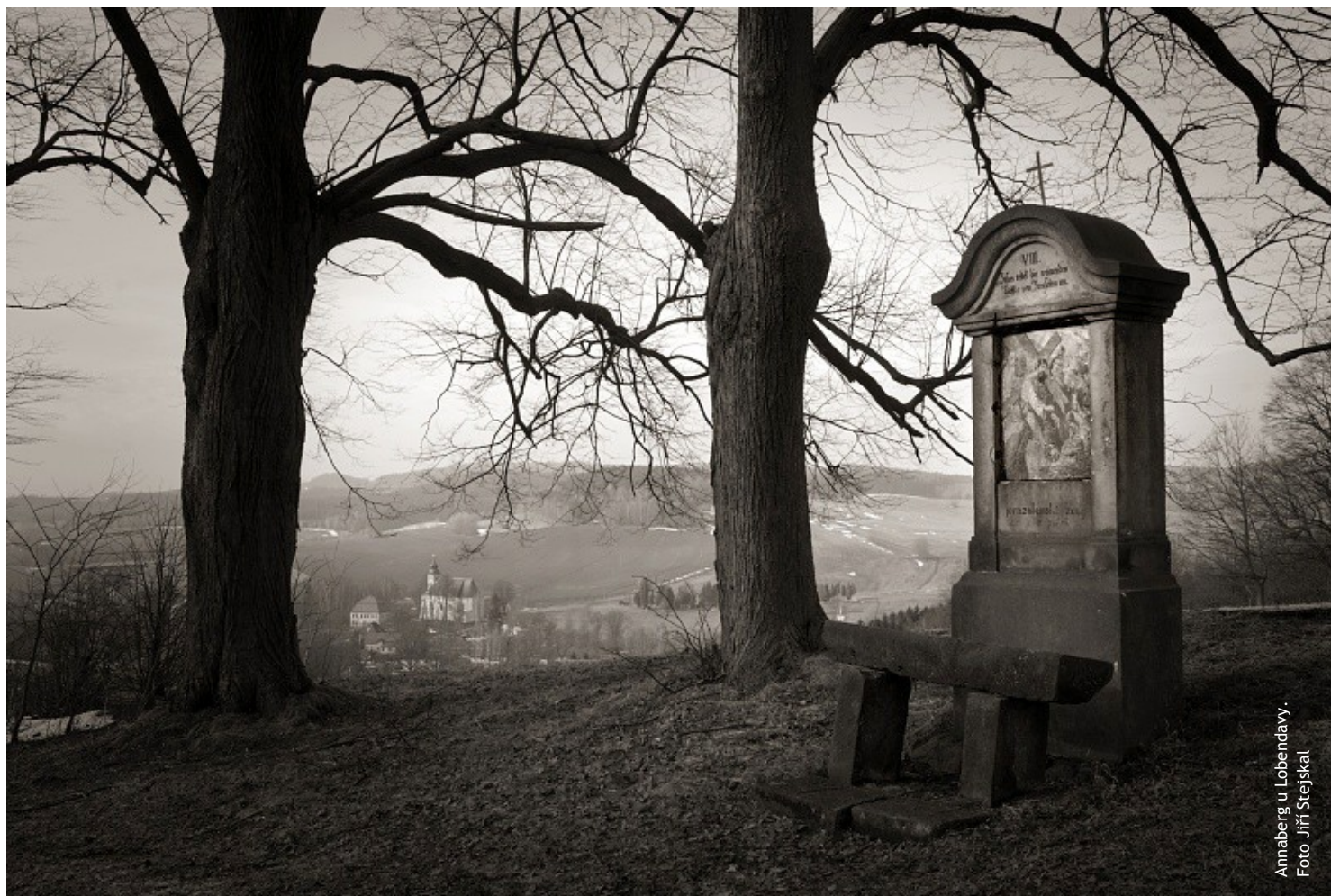
Annaberg u. Lobendavy.